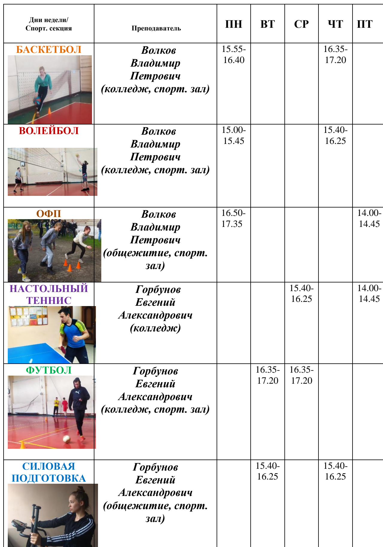
График работы спортивных секций на 2 полугодие 2022-2023 учебного года